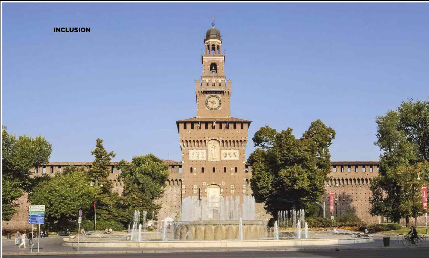
Il Castello Sforzesco a Milano

da Nord a Sud. Si va dalla Venaria Reale di Torino al Negozio Olivetti di Venezia, dalle quattro sedi del Museo nazionale romano nella Capitale all'Abbazia di Santa Maria di Cerrate nella campagna leccese. Tutti luoghi che hanno scelto di aprirsi a ogni