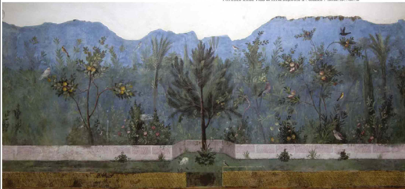
Affresco della Villa di Livia esposto a Palazzo Massimo, Roma

esempio, tra gli altri, il Bosco di San Francesco ad Assisi, il Giardino della Kolymbethra ad Agrigento, il Parco Villa Gregoriana a Tivoli (RM). Lo scorso dicembre si è aggiunta un'altra tappa di riguardo: il Castello Sforzesco di Milano, con i sei musei