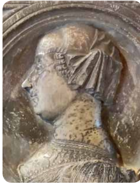
Bianca Maria Visconti

Dopo un po' di anni Bianca Maria Visconti sposa Francesco Sforza. Dopo il matrimonio Francesco diventa il nuovo duca di Milano. Anche la famiglia Sforza era una famiglia molto potente di Milano. Francesco Sforza ha fatto costruire nuove parti del Castello per farlo diventare più grande.